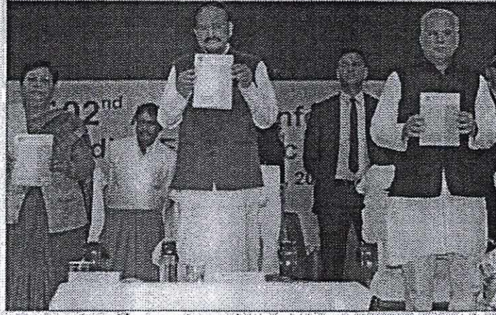
उपसभापति, श्री एम. वैकेया नायडू ने रायपुर में भारतीय आर्थिक संघ के 102वें वार्षिक सम्मेलन के उद्घाटन के अवसर पर, भारतीय आर्थिक पत्रिका की एक विशेष मात्रा का विमोचन किया।

102 Annual Conference of The Indian Economic Association December 27-29, 2019